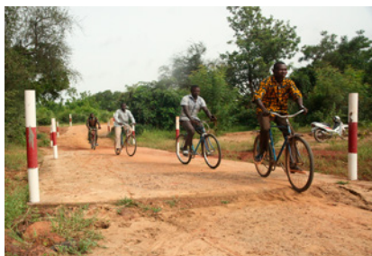
Radier d'Essow, Poun, avril et août 2017

Grâce aux primes de développement durable, reversées par la Société Clarins, JdM BF a pu faire construire un radier (retenue d'eau assez large pour laisser passer les villageois et assez basse pour laisser l'eau passer en cas de forte crue). Cette dernière permet de désenclaver tout un quartier de Poun pendant la saison des pluies. Au delà, c'est tout le niveau de la nappe phréatique qui augmente, limitant ainsi le tarissement de tous les puits alentours. Plus de 3 000 producteurs bénéficient alors de nouveaux espaces de production. Ce sera ainsi le deuxième radier financé par JdM BF à Poun avec l'aide de Clarins.