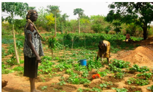
Femmes entretenant la zone de production de Mogueya, août 2017

Les zones de production maraîchère ont pour objectif d'assurer la sécurité alimentaire dans les villages partenaires et de créer des activités génératrices de revenus à travers la commercialisation de légumes.