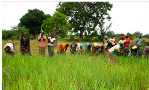
Travaux communautaires de nettoyage, jardin n°1, Poun, août 2017

Depuis leur création, les six jardins communautaires créés produisent et rendent disponibles les plantes médicinales en tout temps au bénéfice des populations locales. Ils sont entretenus par les groupements partenaires.