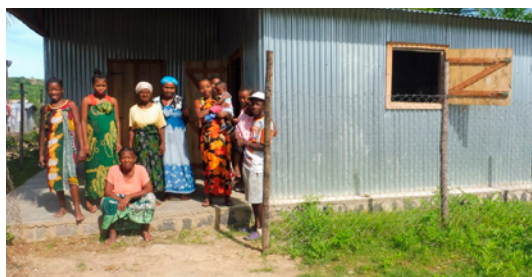
Le groupement de Betahitra devant leur nouveau local, décembre 2017

JdM a financé la construction d'un local de séchage et de stockage à Betahitra pour assurer de bonnes conditions pour une production future.