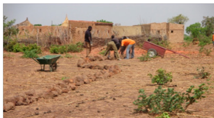
Réalisation de cordons pierreux, avril 2017, Boutoko

Depuis 2012, ce sont plus de 30 000 mètres d'alignement de pierres qui ont été réalisés par les villageois eux-mêmes, appuyés techniquement par Gha. Ces retenues d'eau artisanales permettent de retenir l'eau pendant la saison des pluies, de réalimenter les nappes phréatiques, d'éviter l'érosion des sols et ainsi d'augmenter les rendements agricoles.