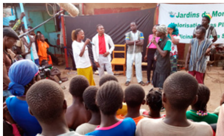
Sensibilisation théâtrale, marché de Kassou/Koudougou, décembre 2017

En novembre 2018, JdM BF a recruté un animateur théâtre, Soumaila Yaméogo. Depuis, il a pu créer sa troupe. Les thèmes de sensibilisation retenus abordent les questions d'hygiène alimentaire et corporelle, les gestes élémentaires pour protéger l'environnement, le bon usage des plantes médicinales, les dangers des faux médicaments, la prévention du paludisme et l'importance d'une alimentation équilibrée.