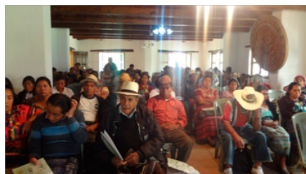
Atelier ordinaire des prêtres mayas du Quiché au sujet de la santé mentale