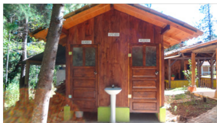
Nouveau sanitaire réalisé, centre de formation des Medes, Chinique, Guatemala