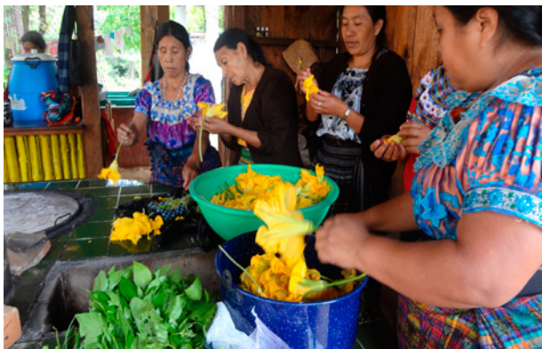
Atelier d'échange sur la cuisine de plantes, association "Médicos descalzos", partenaire de JdM, Chinique/Guatemala