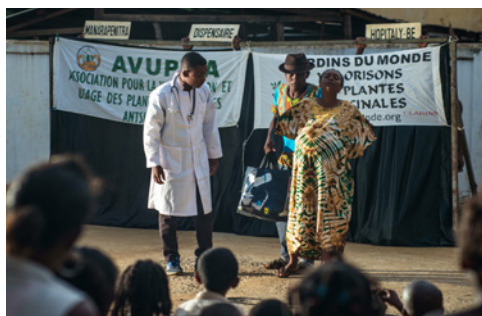
Scénette qui a pour but d'orienter la population vers les différents centres hospitaliers de la région, novembre 2017, Diego Suarez

Sur l'année 2017, plus de 1 250 personnes ont assisté à ces représentations. Le théâtre s'avère donc être une façon ludique intéressante pour sensibiliser un large public à l'usage des plantes médicinales.