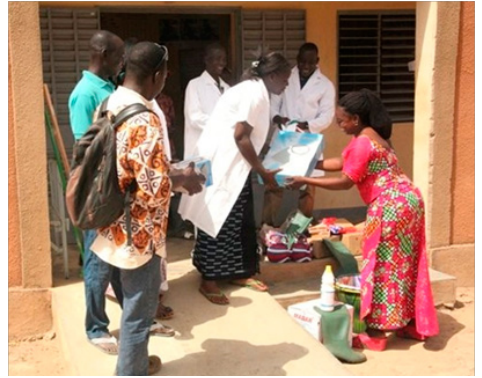
Don de matériel au centre de santé de Poun, avril 2017

Durant l'année 2017, nous avons étudié la faisabilité d'équiper ces trois dispensaires en panneaux solaires et frigos permettant de mieux conserver les vaccins et autres traitements médicaux. Selon les devis reçus, nous pourrions doter ces centres de santé de ces équipements d'ici 2020, en commençant par celui de Mogueya en 2018.