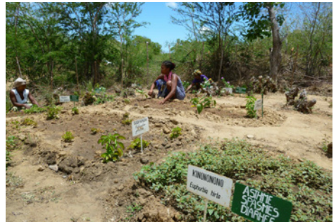
Entretien du jardin pédagogique de Betahitra par le groupement partenaire VMT, novembre 2017

Le jardin de la Croix-Rouge de Diego Suarez accueille toujours de nombreux visiteurs. Des visites guidées avec des classes du Collège français et des partenaires locaux y ont été organisées. Ceci sans compter les nombreuses formations qui y ont eu lieu.