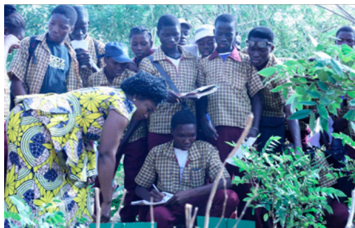
Elèves de seconde du lycée provincial de Koudougou en formation au jardin de Kassou, avril 2017