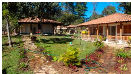
Vue sur le jardin 2 du centre de formation des Medes, Chinique, Guatemala

En 2017, plus de 39 ateliers ont été organisés sur les thématiques liées à la santé publique :