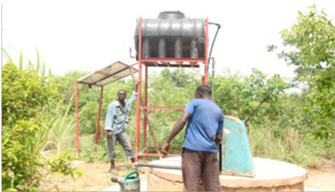
Plaque et pompe solaires installées sur le deuxième puits, Kassou, avril 2017

A Kassou, ce sont plus de 150 espèces de plantes médicinales qui continuent d'être entretenues par l'équipe. L'année 2017, particulièrement sèche, a nécessité un important travail d'arrosage.