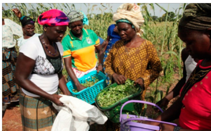
Récolte de plantes, Poun, août 2017

En 2017, plus de 100 kg de feuilles ont été récoltées et séchées par le groupement de Poun composé de 54 récoltants, essentiellement des femmes. Cette production leur a rapporté des revenus conséquents leur permettant, entres autres, d'acheter des vivres en saison sèche, de mieux se soigner ou encore de payer les frais de scolarité de leurs enfants.