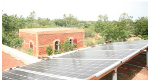
Vue du dessus des deux cases d'accueil de Kassou, juillet 2017