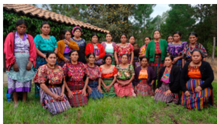
Sages-femmes de Chinique formées au sein du centre des Medes