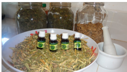
Exemple de produits officinaux fabriqués par l'équipe des Medes