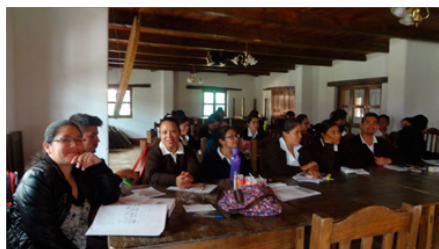
Atelier auprès des autorités de santé au centre de formation des Medes