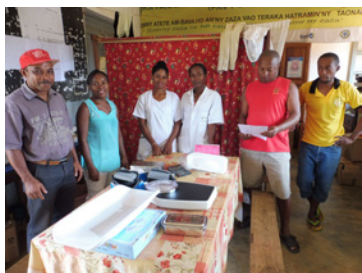
Don de matériel médical, centre de santé d'Anivorano, décembre 2017