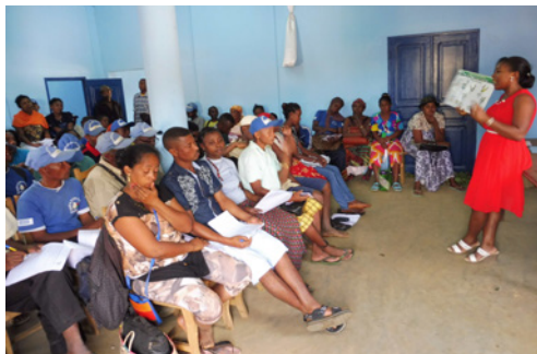
Formation des agents communautaires de santé, septembre 2017, Anivorano