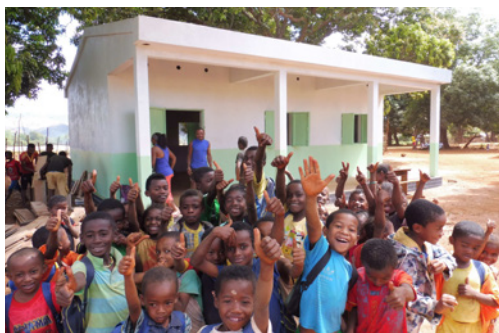
Les enfants de Madirobe manifestent leur joie de bénéficier d'une nouvelle salle de classe, octobre 2017

Avec 221 élèves qui fréquentent l'école primaire publique de Madirobe, les salles de classe étaient souvent surchargées et en très mauvais état. Grâce à cette nouvelle salle de classe, financée par les primes de développement responsable, reversées par la société Clarins dans le cadre du commerce équitable, 40 écoliers pourront profiter d'un meilleur environnement pour étudier.