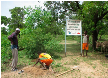
Installation de panneaux et de bornes, aire protégée de Boutoko, juin 2017

La Fédération nationale des tradipraticiens a félicité l'équipe de JdM BF en fin d'année 2017 pour la valorisation de ces aires protégées qui leur permettent d'avoir accès aux plantes utiles pour soigner leur entourage. Ils nous encouragent à en faire autant dans d'autres localités qui souffrent de la problématique majeure d'accaparement des terres. Cette dernière, désignant l'achat massif de terres par certains pays ou investisseurs privés, présente une forte menace pour le développement local et la sécurité alimentaire des populations concernées.