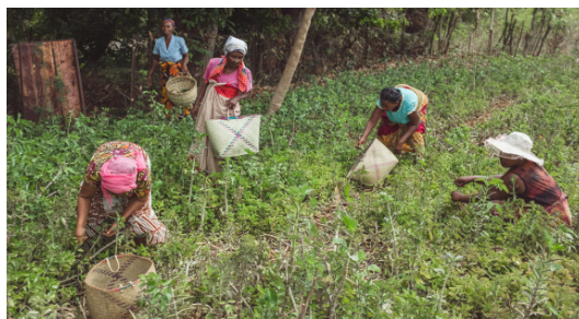
Récolte de plantes, site de production de Madirobe, décembre 2017.

En 2017, les groupements partenaires de JdM Mada ont de nouveau assuré une production de plus de 1 200 kilos de plantes. Chaque partenaire a bénéficié ainsi de revenus complémentaires conséquents.