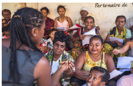
Formation de mères de famille au jardin pédagogique de la Croix-Rouge, décembre 2017, Diego Suarez.

45 formations ont été menées à Diego Suarez et dans le district de Diego II. Au total, plus de 350 personnes ont été formées sur l'année.