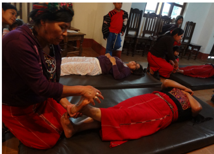
Apprentissage des massages traditionnels.