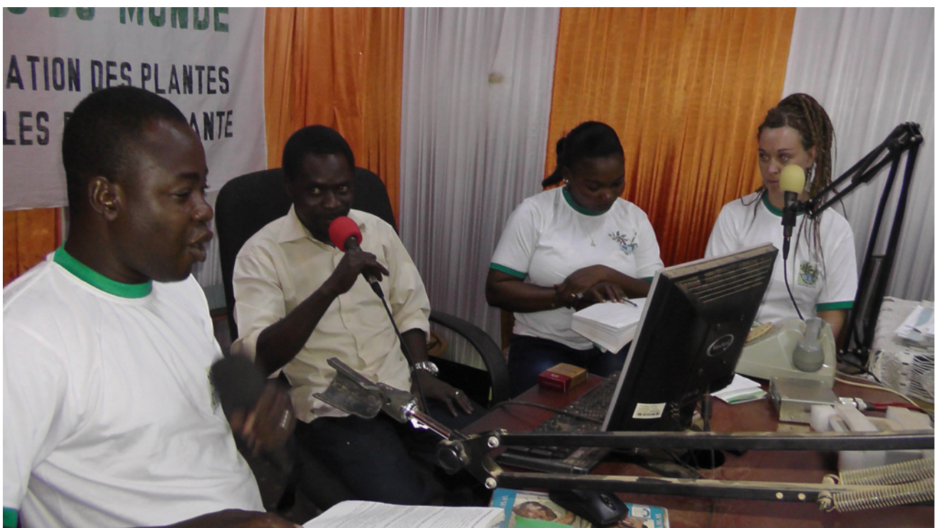
Premier direct pour l'équipe de JDM BF.