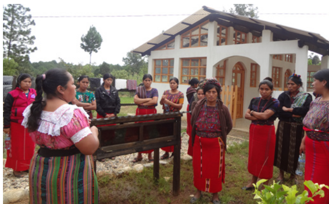
Formation dans le jardin de plantes médicinales.

Les anciens adhérents de JDM ne seront pas étonnés que l'on parle ici de sages-femmes. En effet, dès mon arrivée à Chinique en janvier 1992, après l'enquête ethnobotanique et l'étude scientifique des plantes recensées, la demande s'est rapidement portée sur la mise en place d'un jardin, la réalisation de produits officinaux simples – sirops, pommades et teintures – et la formation des sages-femmes traditionnelles.