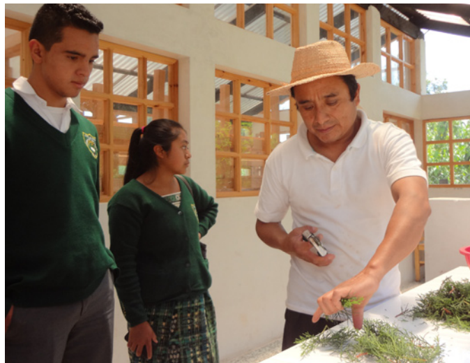
Formation des étudiants par Medicos descalzos.