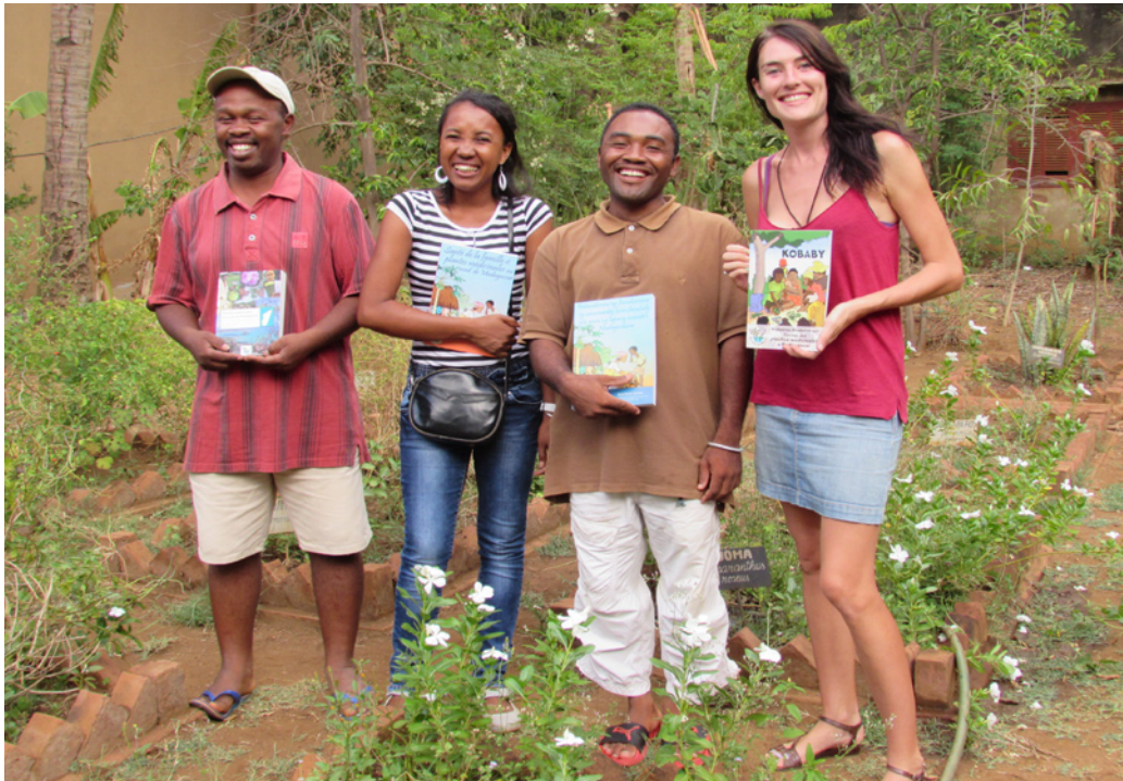
Bonnes fêtes ! L'équipe de JDM Mada.

L'équipe de Madagascar vous souhaite de belles fêtes de fin d'année !