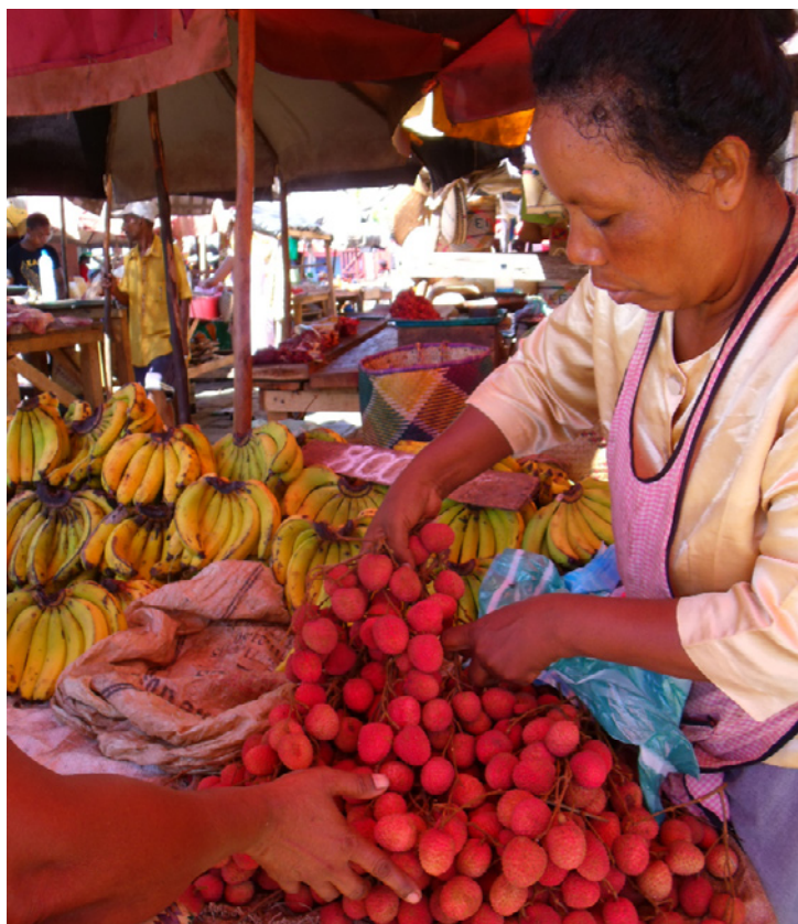
Pas de neige ici mais les litchis de Noël sont arrivés sur le marché !