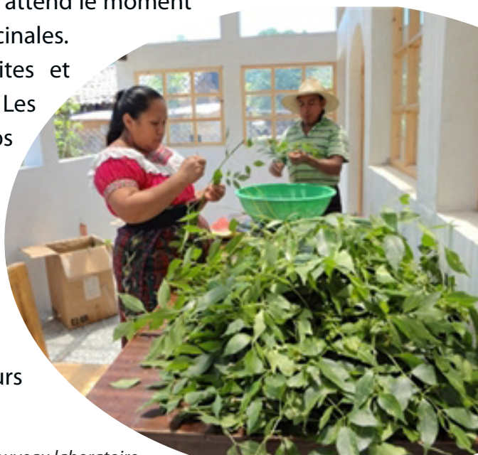
Préparation des plantes dans le nouveau laboratoire.

Déjà, le centre de soin est ouvert aux patients 3 jours par semaine.