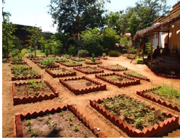
Jardin pédagogique de la Croix rouge, Antsiranana