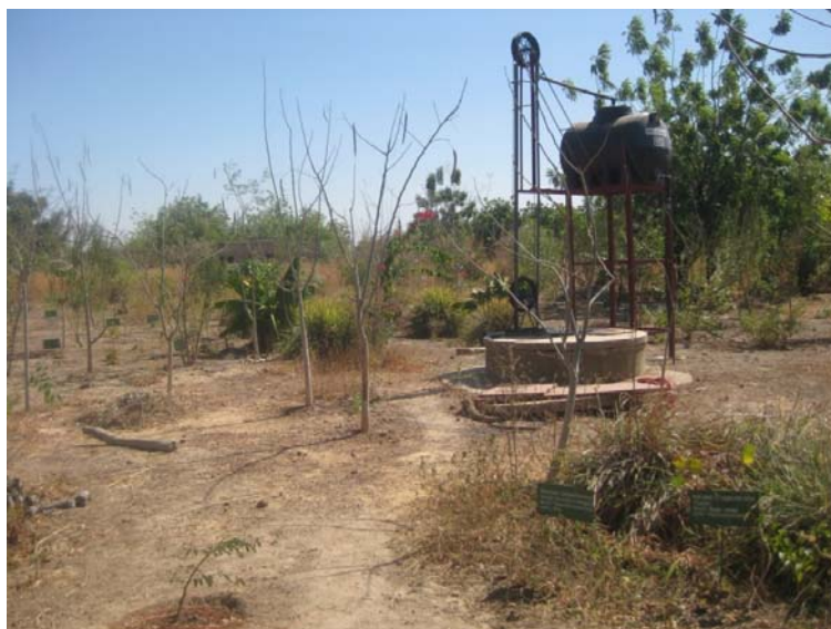
Jardin pédagogique de Kassou, en décembre 2013, un de nos puits, équipé d'une pompe manuelle et d'une réserve d'eau de mille litres