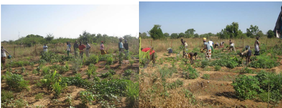
Photos d'une zone de production animée et valorisée par JDM BF à Mogueya, depuis 2011

Du point de vue du partenariat entre JDM BF et le village de Mogueya, le bouli permettra non seulement de créer des zones de production et de préservation de plantes médicinales mais également de développer des travaux de maraîchage, de cultures vivrières et toutes les cultures de contre-saison. L'alimentation en eau du bétail sera aussi possible.