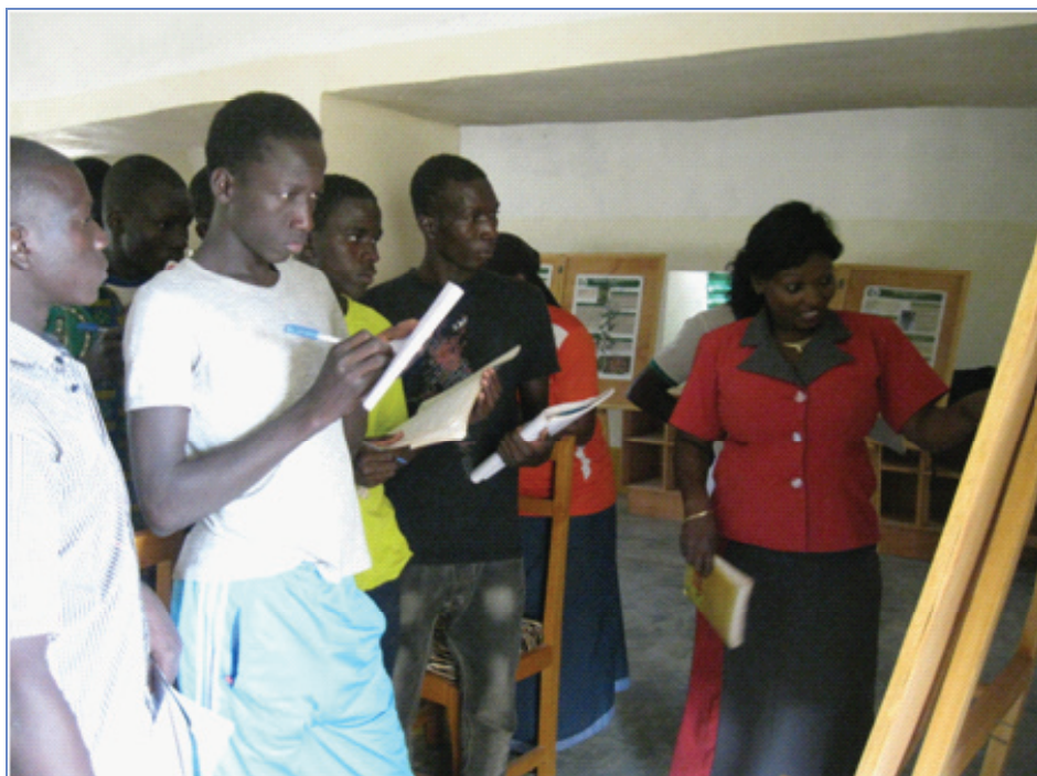
Formation des élèves du lycée Kiswendsida dans la salle du jardin pédagogique de Kassou, novembre 2015

Le jardin pédagogique de Kassou se transforme en lieu de formations et de découvertes.