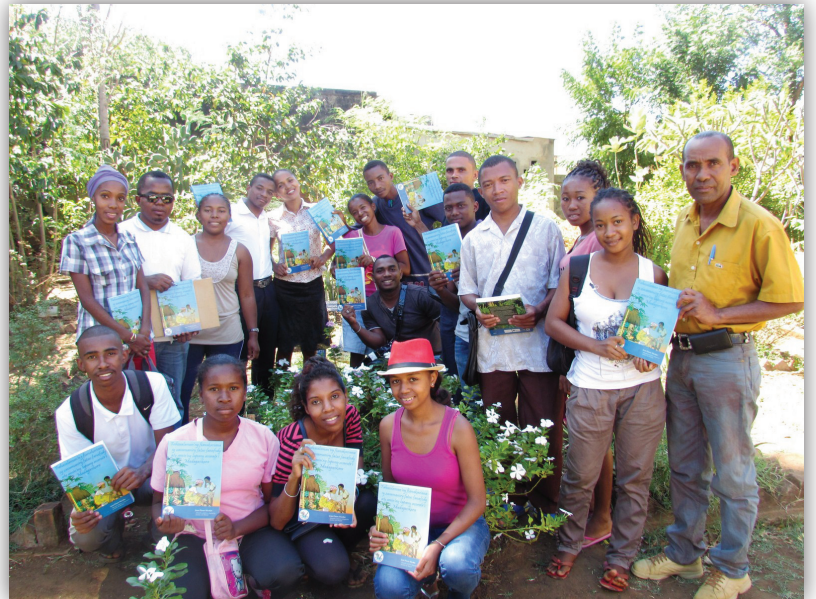
Remise des manuels en langue malgache aux membres de « La mission pour l'emploi », participants aux formations de JdM, Antsiranana, août 2015