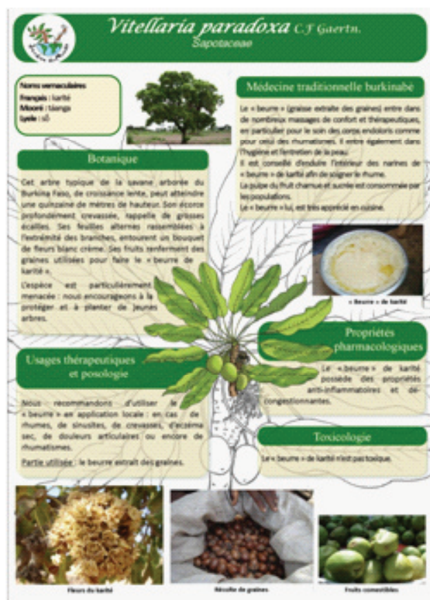
Extrait du recueil sur les plantes médicinales du Burkina Faso

Les affiches créées en 2014, reprenant les informations ethnobotaniques sur les plantes médicinales les plus utilisées, ont été regroupées en un recueil.