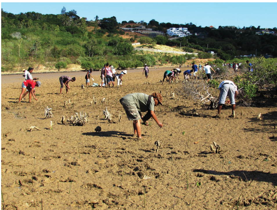
Reboisement des mangroves, Journée mondiale de l'environnement, Ampasira, juin 2015

En février 2015, JdM a participé au projet de reboisement de l'association Sage à la montagne des français : plantation de différentes espèces endémiques de Madagascar.