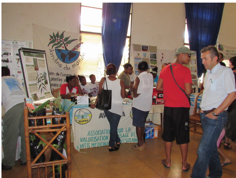
Stand JdM et exposition des posters lors de la Journée mondiale de l'environnement, mairie d'Antsiranana, juin 2015

L'exposition a été affichée pendant un mois à la bibliothèque municipale d'Antsiranana, au bloc administratif, à la mairie (lors d'un stand JdM à la journée mondiale de l'environnement et une seconde exposition affichée pendant un mois) et au lycée mixte.