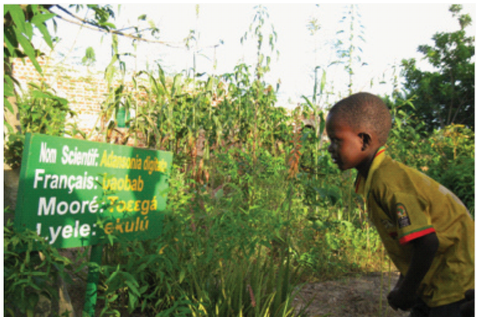
Visite d'un enfant dans le jardin de Kassou, septembre 2015

Ceci a permis d'introduire de nouvelles espèces et à la terre d'absorber suffisamment d'eau pour les faire perdurer.