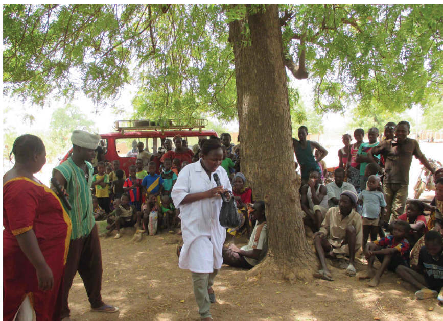
Sensibilisation par le théâtre à l'usage des plantes médicinales dans le village de Poun, avril 2015

Avec des jeunes motivés, il préparera des scénettes sur le thème de la santé au jardin pédagogique de Kassou et, ponctuellement, donneront des représentations dans les villages.