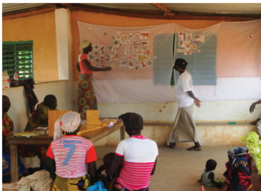
Formation des personnes "relais" pour le suivi nutritionnel des enfants à Mogueya au CREN de Ladio

370 sachets de farines enrichies ont été distribués.