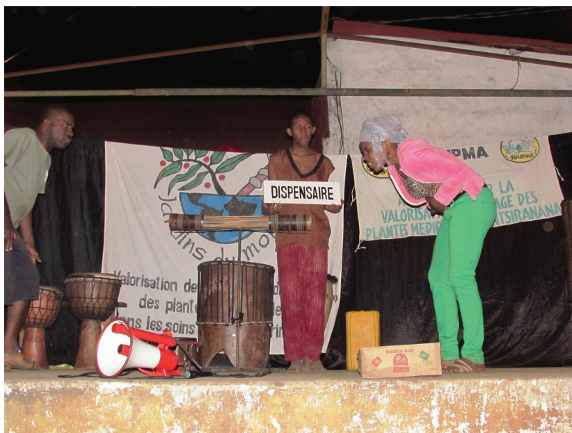
Sensibilisation théâtrale à Anivorano, août 2015

En 2015, les sensibilisations ont eu lieu dans 6 villages de la Région Diana et 4 représentations à Diego Suarez. En moyenne, les sensibilisations attirent plus de 200 personnes en zones rurales et une petite centaine à Diégo. Presque systématiquement, le chef du village nous sollicite ensuite afin d'y organiser des formations à la santé. Au total, plus de 1 500 personnes ont pu être sensibilisés sur ces thèmes en 2015.