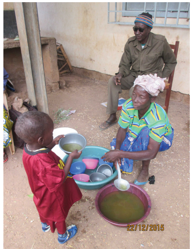
Distribution d'une décoction pour le soin des affections respiratoires, préparée lors d'une formation santé à Mogueya, décembre 2015

La dernière séance teste les connaissances acquises des participants. Les résultats de ce test permettent de réadapter le programme pour l'année suivante.