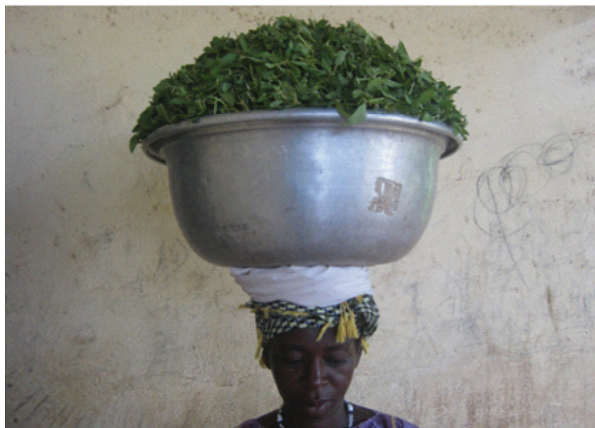
Femme du groupement de Poun portant la récolte de feuilles fraîches, septembre 2015

Les bénéfices des récoltes sont répartis entre les membres du groupement et sont souvent utilisés pour les frais de scolarité et les dépenses courantes des foyers.