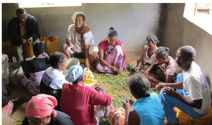
Les producteurs locaux des associations Mamafy Soa et Fivemia lors du séchage et triage des plantes, mai 2015.