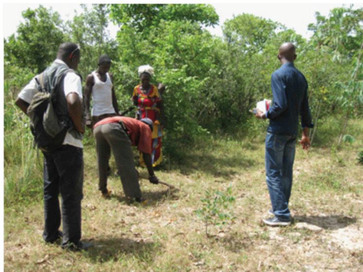
Délimitation de la zone protégée lors du levé topographique, novembre 2015

Ainsi, nous pourrons sensibiliser les habitants à ne pas ramasser du sable ou couper des arbres sur ce périmètre avec l'appui des agents de l'environnement et des autorités locales