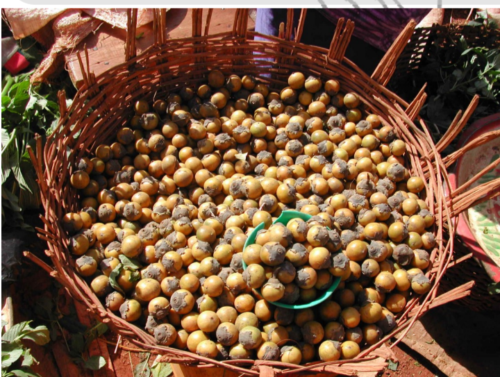
Fruits mûrs vendus sur le marché

La littérature consultée n'a pas fourni d'éléments concernant la toxicité de cette plante.