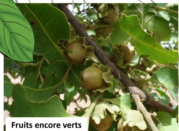
Fruits encore verts